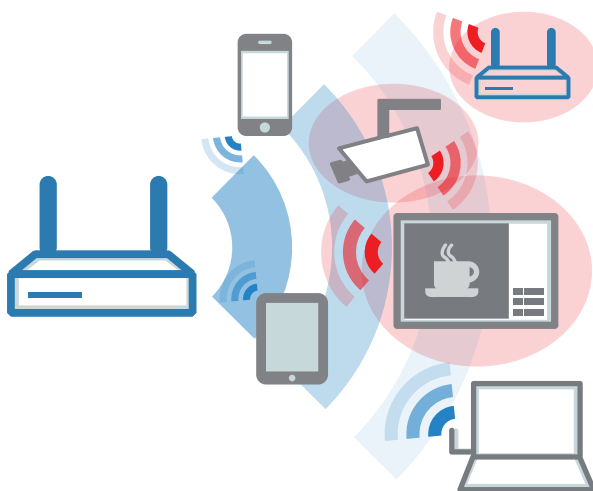
Grafik 3: Adaptive Noise Immunity

WLANs operieren häufig in schwierigen Umgebungen mit vielen unterschiedlichen Störsignalen, die die Leistungsfähigkeit des eigenen WLANs stark beeinflussen können. Potenzielle Störquellen sind dabei weitere WLAN-Signale von fremden Access Points, oder aber auch andere Funksignale wie Bluetooth-Geräte, Funkkameras und Mikrowellen, die erheblichen Einfluss auf das WLAN haben können. Mit aktivierter Adaptive Noise Immunity blendet ein Access Point diese Störsignale im Funkfeld aus und fokussiert sich ausschließlich auf WLAN Clients mit ausreichender Signalstärke. Dies wird erreicht, indem das WLAN-Modul permanent Messwerte über Interferenzen im Funkfeld liefert. Wird ein definierter Schwellwert überschritten,