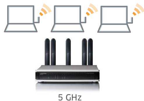
Grafik 2: Band Steering