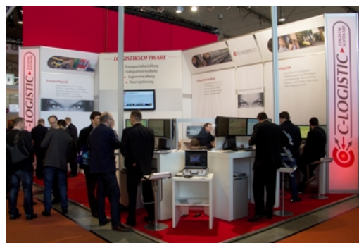
Reger Betrieb am Messestand der C-Informationssysteme GmbH