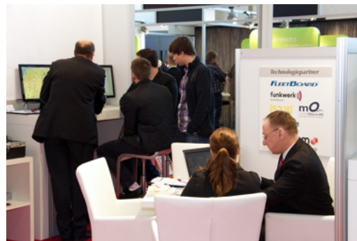
Kundengespräche mit intensivem Austausch