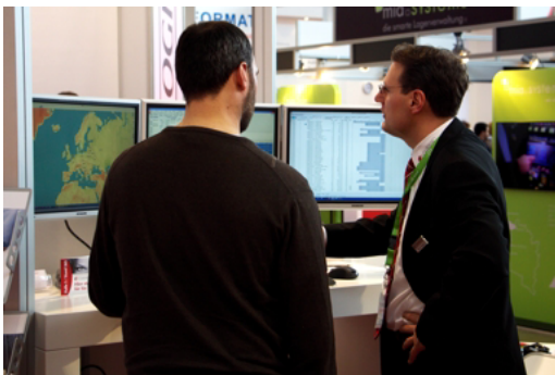
Live am Messestand konnten den Besuchern die Abläufe im System gezeigt werden