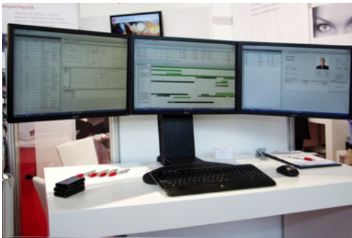
Das Dispo-Cockpit gibt eine Vorschau auf die Version 5