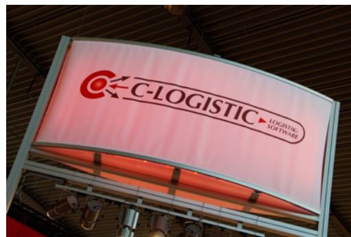
Messestand mit Fernwirkung