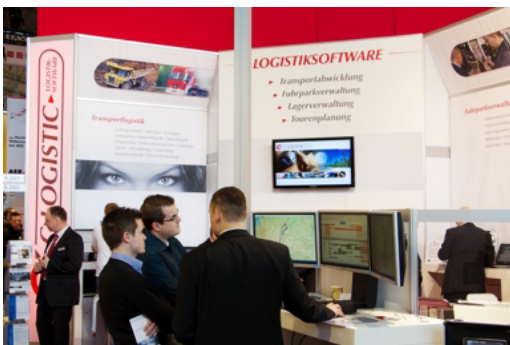
Sowohl Kunden als auch Interessenten interessierten sich für die Features der Logistik- und Speditionssoftware