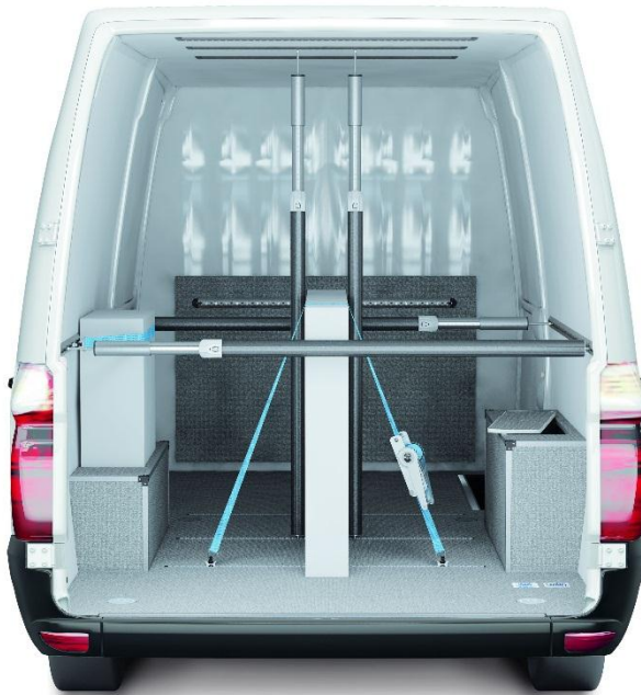
Abbildung 2 VANyCARE®-Komplettausstattung