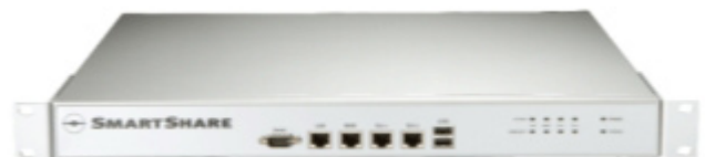
Die SmartShare StraightShaper 1000 Serie ist in einem montierbaren 1U Rack-Gehäuse erhältlich

Die QoS-Technologie von SmartShare weist keinen dieser Nachteile auf. Der gesamte Voice- und Datenverkehr wird dynamisch auf der Basis der aktuellen Erfordernisse abgewickelt und optimiert auf diese Weise den Gebrauch des Internetanschlusses ohne Bandbreite zu reservieren, die nicht genutzt wird. Auf diese Weise sparen Sie Internetkosten, gleichzeitig garantieren Sie Servicequalität.