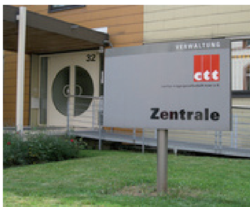
Cusanus Trägergesellschaft Trier

Die cusanus trägergesellschaft trier mbH ist ein kirchlicher Träger von Krankenhäusern, Reha-Fachkliniken, Altenhilfeeinrichtungen und einer Jugendhilfeeinrichtung. Als gemeinnütziger Verein betreibt sie 32 Einrichtungen in drei Bundesländern mit dem Schwerpunkt in Rheinland-Pfalz und im Saarland. Über 5.000 Mitarbeiter sorgen für eine ganzheitliche, professionell organisierte Hilfe und Versorgung kranker und alter Menschen.