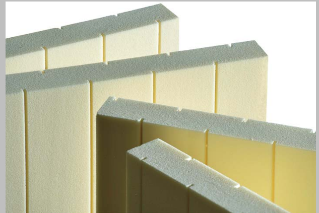
Abb_02: Professionell, zuverlässig, maßgenau: foradur Plattenzuschnitte für die Fertigung von Haustürfüllungen.