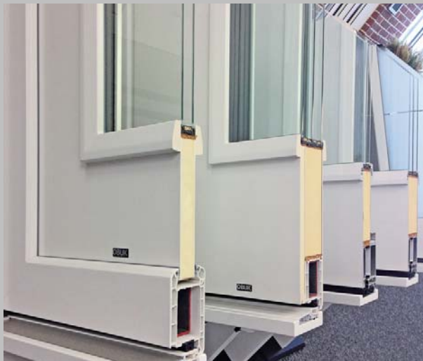
Abb_03: Professionell, zuverlässig, maßgenau: foradur Plattenzuschnitte für die Fertigung von Haustürfüllungen.