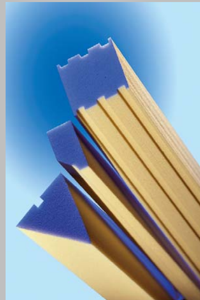
Abb_04: Nach Kundenvorgabe gefertigte Profile für die Fenster- und Türenproduktion. Abbildung: puren

Hier geht es zum Download hoch aufgelöste Bilder + entformatiertes Word-Dokument