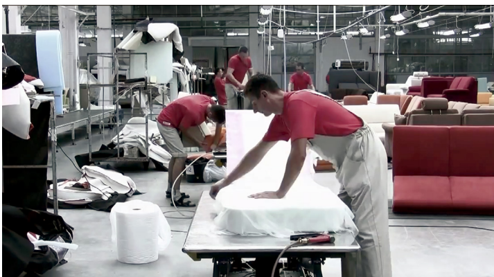
Blick in die Fertigungshalle

Darüber hinaus waren Auswertungen, die über die bestehenden Prozesse hinausgingen (Statistiken etc.) besonders kompliziert. Themen wie Archivierung von Aufträgen und Langzeitdatenhaltung für Langzeitauswertungen waren nahezu unmöglich.