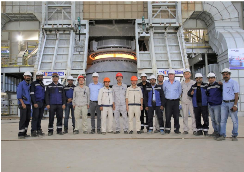
Die Projektteams von Hoa Phat, Vietnam, WISDRI Engineering & Research Incorporation Ltd. und SMS group, Deutschland, sind stolz auf die reibungslose Inbetriebnahme.

SMS group ist eine Gruppe von international tätigen Unternehmen des Anlagen- und Maschinenbaus für die Stahl- und NE-Metallindustrie. Rund 14.000 Mitarbeiterinnen und Mitarbeiter erwirtschaften weltweit einen Umsatz von über 2,8 Mrd. EUR. Alleineigentümer der Holding SMS GmbH ist die Familie Weiss Stiftung.