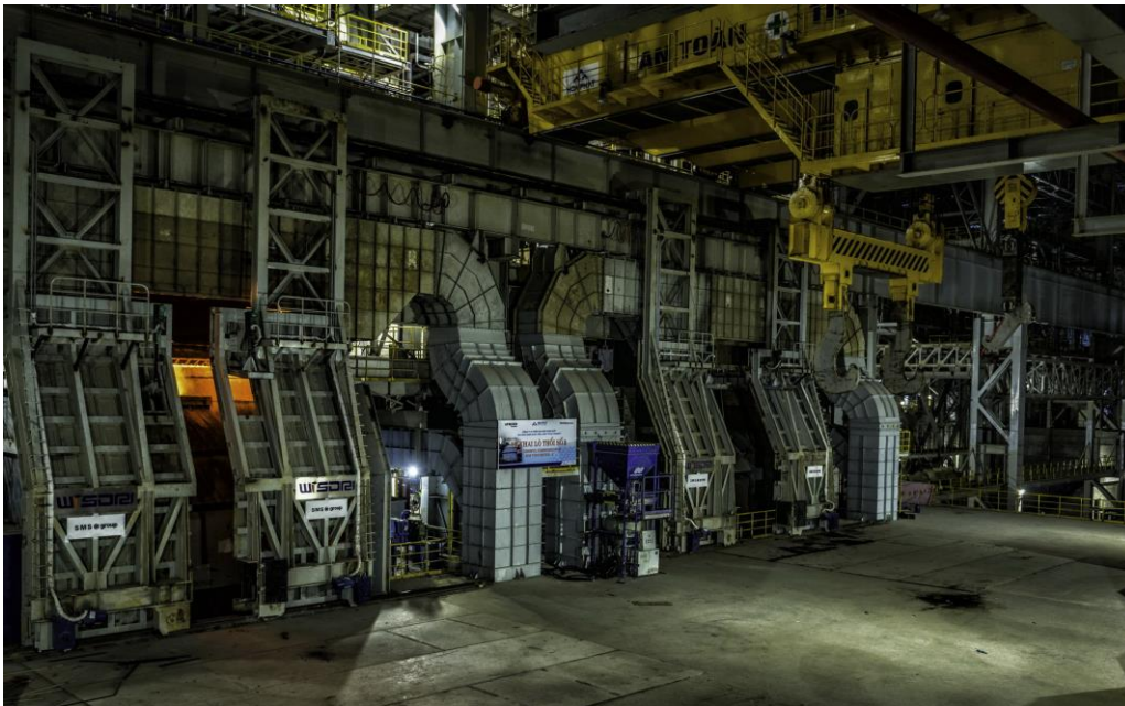
Konverterbühne der installierten Konverter.