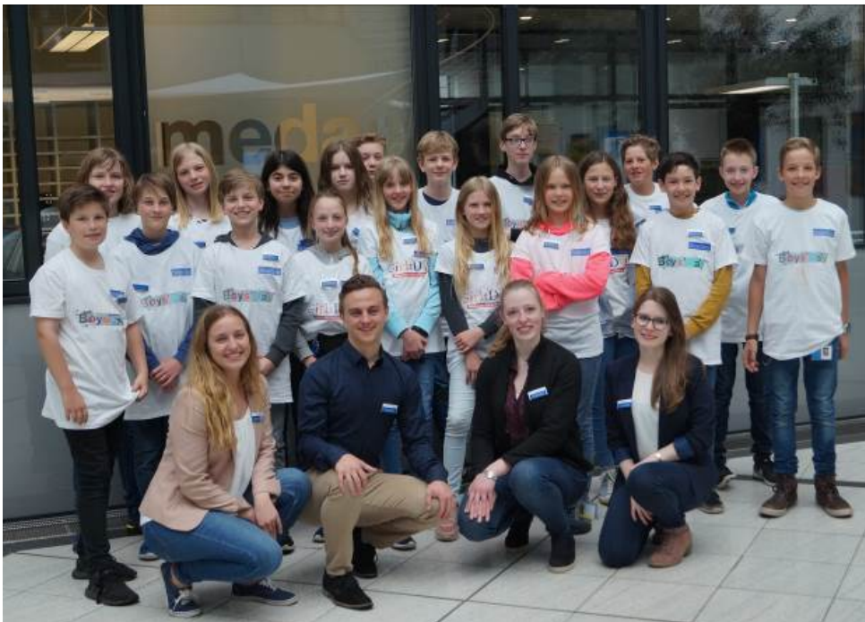
BU: Die vier medac-Azubis mit den Kindern anlässlich des Girls' & Boys' Days 2018