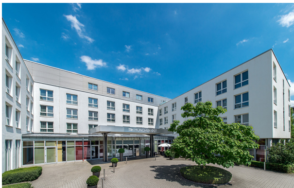
NH München Ost Conference Center

Das Hygienekonzept zum Schutz vor dem Coronavirus richtet sich nach dem geltenden bayerischen Infektionsschutzgesetz. Wir informieren die registrierten Teilnehmer vorab per E-Mail zum aktuellen Stand.