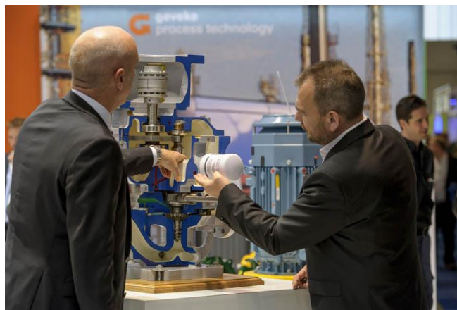
Bild Nr. 07-01a EF_Pumpengespräch.jpg.

Mit 2 Klicks zu Text und Bild unter www.pressearbeit.org .