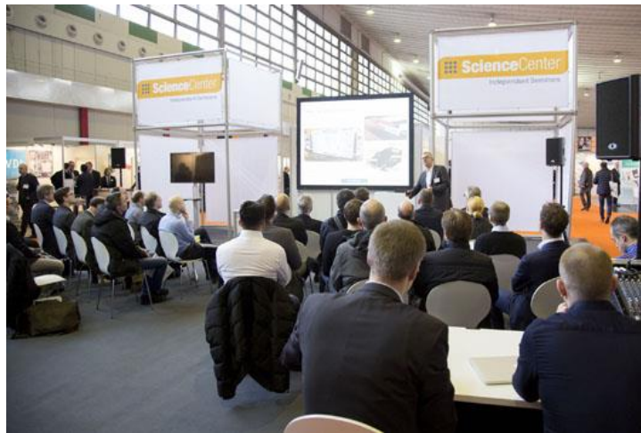
Bild Nr. 07-03a EF_ScienceCenter.jpg.

Begleitet wird der wertvolle Branchentreff von fundierten Fachvorträgen im ScienceCenter der Messen mit Vorträgen zu aktuellen Themen wie Softwarelösungen mit dem Schwerpunkt Industrie 4.0.