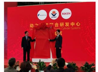
Opening Ceremony in Nanjing