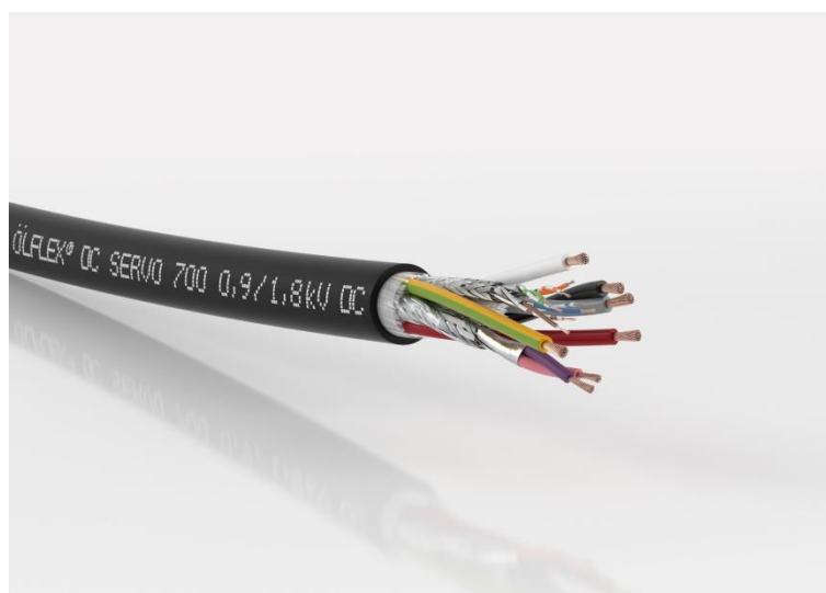
Bild 2: Die ÖLFLEX DC SERVO 700 Anschlussleitung zur Versorgung elektrischer Antriebe mit Gleichstrom eignet sich für den gelegentlich flexiblen Einsatz sowie für die feste Verlegung. Die Leiter sind mit Spezial-PVC isoliert.

LAPP zeigt seine neuen DC-Leitungen auf der Hannover Messe 2019 in Halle 11, Stand C03.