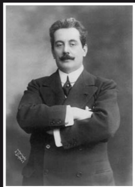
Giacomo Puccini (1858 – 1924) Studierte von 1878 bis 1890 an der Hochschule in Mittweida