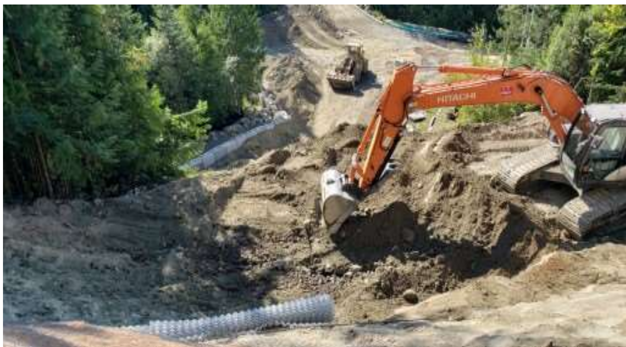
Foto des Beginns der Abtragungsarbeiten der Deckschicht oberhalb des Portals.