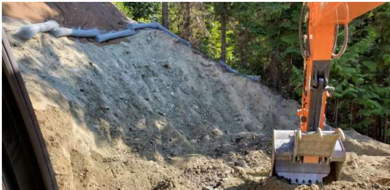
Foto der installierten Abfangwand oberhalb des Abtragungsgebiets.