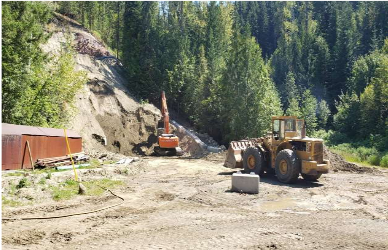
Foto des Beginns der Abtragungsarbeiten mit einem Bagger und einem Lader.

Die Aufsichtsbehörden haben die aktualisierten Genehmigungsunterlagen für die neue Fallstrecke erhalten und das Unternehmen nun aufgefordert, die endgültigen Unterlagen einzureichen und die öffentliche Bekanntgabe einzuleiten. Die Genehmigung für das neue unterirdische Erschließungsprogramm wird erwartet, sobald dieser Prozess abgeschlossen ist.