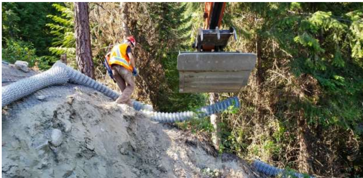
Foto der Installation der neuen Abfangwände durch den Bagger des Typs Hitachi 180.