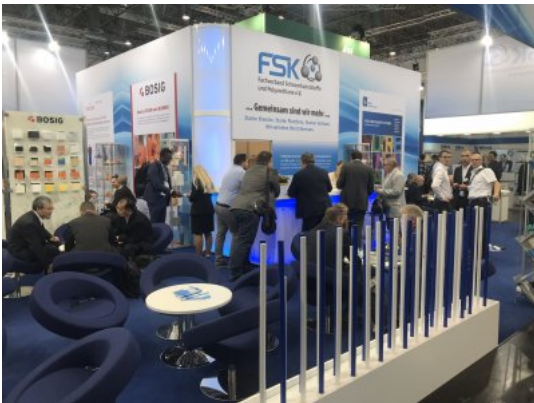
FSK e.V. gemeinsam mit zehn seiner Mitgliedsunternehmen auf der „K“ 2019

Vom 16. bis 23. Oktober präsentierte sich der Fachverband Schaumkunststoffe und Polyurethane e.V. (FSK) zusammen mit zehn seiner Mitglieder unter einem Dach auf der K-Messe in Düsseldorf. Gemeinsam ziehen sie eine positive Bilanz und bestätigen die K-Messe als absolutes Branchenhighlight.