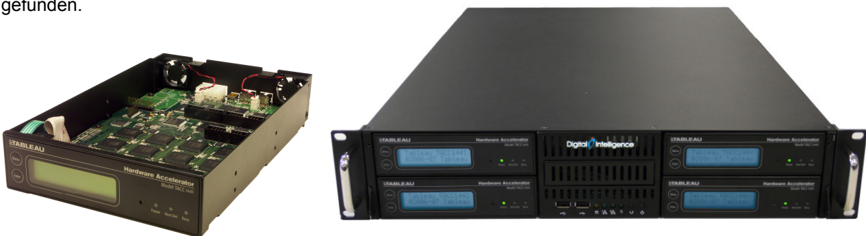
Tableau TACC1441 ist ein Industriestandard für Hardware zur Passwort-Rettung. Die Tableau TACC1441-Geräte sind leicht skalierbar und mehrere von denen können problemlos an einem einzigen Rechner angeschlossen werden. Man kann Tableau TACC1441 als externe Geräte leicht bewegen und jederzeit an jedem Rechner anschalten, um die Leistung dieses Rechners zu steigern. Tableau TACC1441 ist eine umweltfreundliche Lösung, die sehr wenig Strom verbraucht und fast keine Wärme auflost. Deswegen hat Tableau TACC1441 großen Zuspruch bei Behörden, Militär- und Polizeikräften in der ganzen Welt gefunden.

ElcomSoft hat wichtige Innovationen auf dem Gebiet der Informationssicherheit eingeführt. Die von ElcomSoft entwickelte GPU-Beschleunigungs-Technologie war in den USA zum Patent angemeldet. Damit können Benutzer von Consumer-Grafikkarten die Rechenleistungen der Superrechner erreichen. Die proprietäre GPU-Beschleunigungs-Technologie entlastet die Rechnungen auf die hoch skalierbaren parallelen Grafik-Prozessoren, die in den neuesten ATI- und NVIDIA-Karten vorgestellt werden. Wenn ein oder mehrere kompatible ATI- oder NVIDIA-Grafikchips vorhanden sind, fängt die GPU-Beschleunigungs-Technologie automatisch an zu wirken und garantiert eine drastische Verkürzung der Passwort-Rettungszeit.