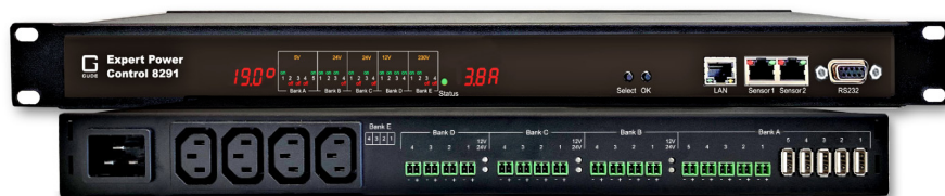
Front- und Rückansicht des Expert Power Control 8291-1

Mit dem Expert Power Control 8291-1 stellt die GUDE Systems GmbH ein Stromverteilersystem vor, dass in professionellen Installationen mit Gleichspannungsbedarf (DC) zum Einsatz kommt. Die schaltbare LAN-Steckdose erlaubt den Anschluss von bis zu 21 Endgeräten aus dem AV- und IT-Bereich. Dabei werden vier verschiedenen Spannungen bedient: 17 schaltbare Stromausgänge mit DC-Spannungen zu 24 V, 12 V und 5 V sowie 4 schaltbare Stromausgänge zu 230 V (AC.) Aufgrund der unterschiedlichen Anschlüsse auf der Geräterückseite (IEC C13, Industrieklemme und USB Typ A) sowie der verschiedenen Versorgungsspannungen können eine Vielzahl von AV- und IT-Verbrauchern angeschlossen werden. Das integrierte Industrienetzteil macht dabei die oft unzuverlässigen Steckernetzteile der Endgeräte überflüssig. Dank kompaktem Aufbau in stabilem Metallgehäuse belegt die PDU nur eine Höheneinheit in 19-Zoll-Schränken.