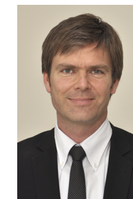
Denise Kramer Agentur Communication, Coordination, Public Relations

Die Wissenschaft ist sich einig: Lernerfolg hängt unmittelbar von den eingesetzten Lerntechniken ab und diese können in jedem Alter neu erlernt bzw. verbessert werden. Entdecken Sie die Möglichkeiten des Lernens. Trainieren Sie Ihr Gehirn für höhere Leistungsfähigkeit, Kreativität und neue Ideen. Sie erhalten einen Einblick, wie Sie in Zukunft bei Ihren Weiterbildungen weniger Zeit investieren müssen, um den Lernstoff zu verinnerlichen und wie Sie gegen das Vergessen, die Verständnisschwierigkeiten und Zeitnot ankämpfen können. Denise Kramer hat jede Menge Tipps und Tricks für effizientes und kurzweiliges Lernen im Gepäck!