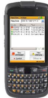
Instandhaltungsaufträge (Variante Tablet-PC)