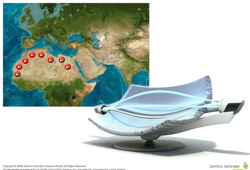
Das von Dominic Schindler Creations designte solarthermische Kraftwerk soll sauberen Strom aus den Wüstenregionen der Erde liefern.