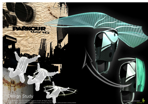
Ein dynamisch futuristisches Fun-Sportgerät – Kompakt gefaltet und rucksackartig auf den Rücken geschlallt, begleitet die Flughilfe den Sportler bei seinem Run durch die urbane Kulisse.