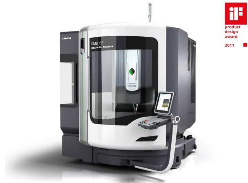
High-End Werkzeugmaschine – innovatives Produktdesign vereint anspruchsvolles und formvollendetes Design mit maximaler Funktionalität.