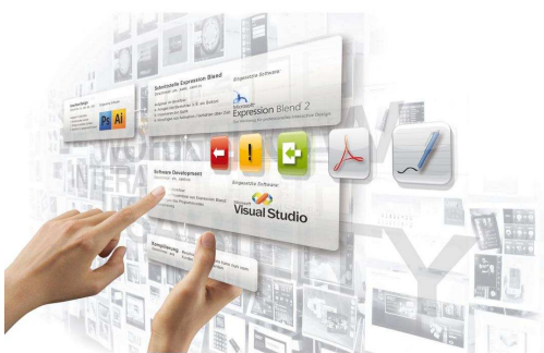
Ein Spezialgebiet der Design Agency ist das Interface Design. Immer mehr Produkte verfügen über eine solche Schnittstelle zwischen Anwender und Produkt – meist über ein Display.