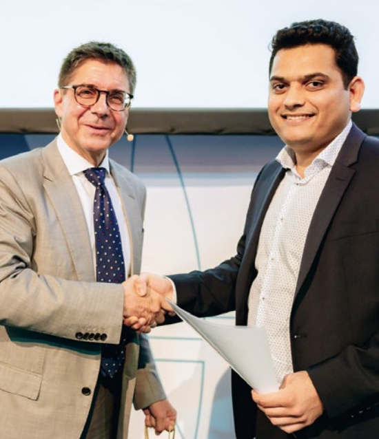
Verleihung der renommierten Auszeichnungen im Facility Management