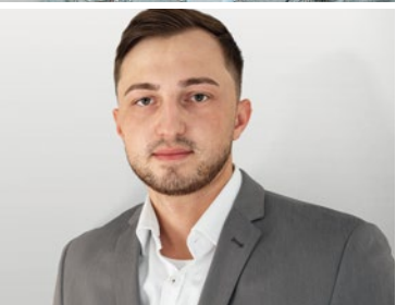
Gewinner der GEFMA Förderpreise 2020