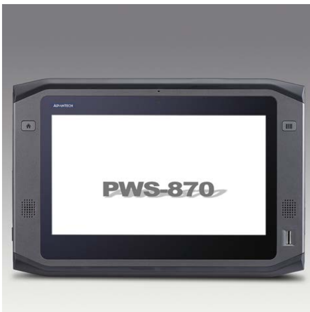
BU: Tablet > PWS-870