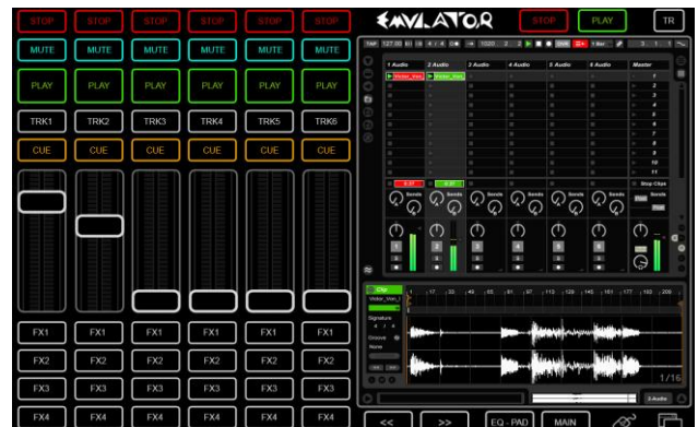
Emulator Multitouch-Layouts für Ableton