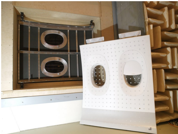
Versuchsaufbau im Transmissionsprüfstand mit CFK-Rumpfstruktur (in der Prüföffnung) und Seitenwandstruktur (zur Kopplung an die Rumpfstruktur) für die Entwicklung und Erprobung von adaptronischen Smart Linings.