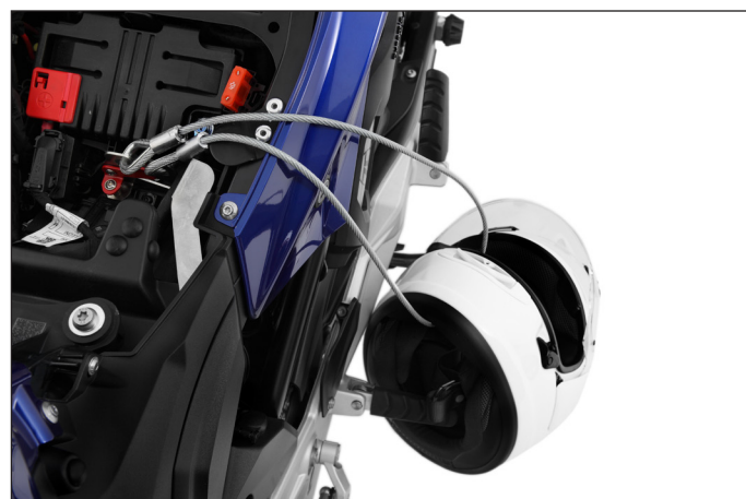
Die Länge des Sicherungsseils ist so bemessen, dass bis zu zwei Helme gesichert werden können