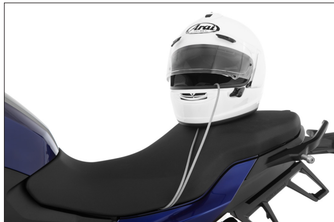
Helm-Diebstahlsicherung »HELM-LOCK« - jetzt auch für die BMW F 900 R und XR (Art.-Nr.: 44320-800)

44320-800 - Wunderlich Helm-Diebstahlsicherung »HELM-LOCK« (68,14 €)