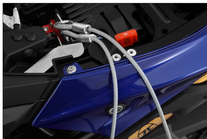
Hält langfingrige Ganoven auf Abstand: 5 mm dickes Drahtseil sichert den Helm vor Diebstahl