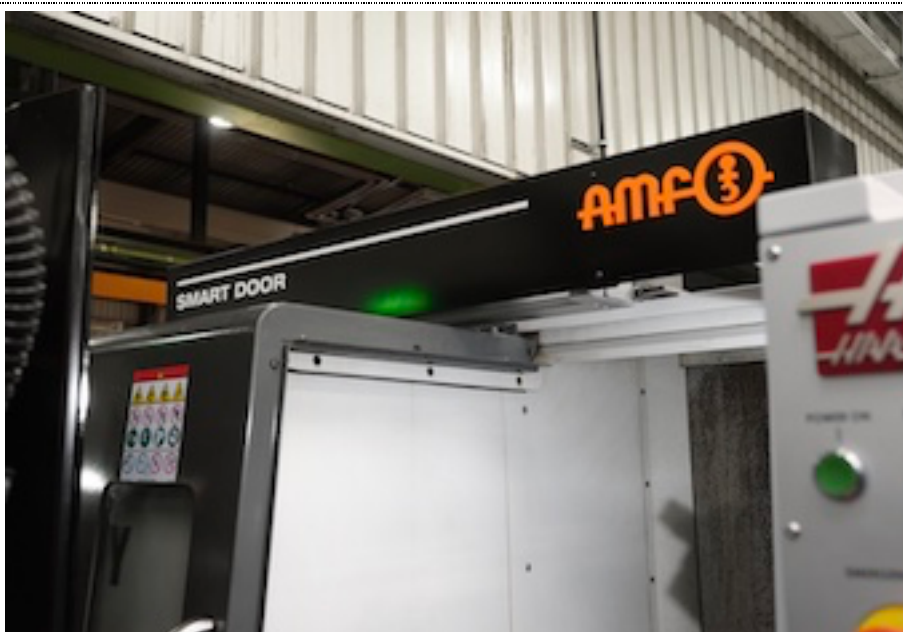
Bild Nr. 133-09 AM_AWB-GÜ-Door.jpg.

Für Werkzeugmaschinen ohne automatische Türöffnung gibt es von AMF den Türöffner Smart Door in verschiedenen Ausführungen für unterschiedliche Öffnungsbereiche. Smart Door ist kompatibel mit allen gängigen Maschinenausführungen und einfach nachrüstbar.