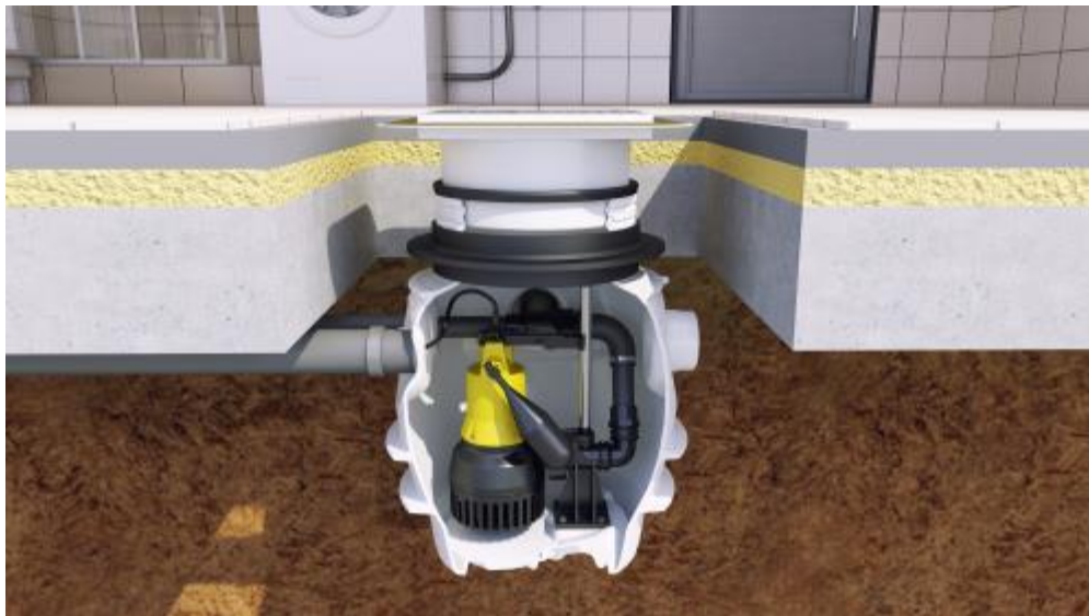
Bild 2: Schnitt durch einen Kellerboden mit dem BAUFIX 100 inklusive Grundwasserabdichtung. Eingesetzt wurde hier eine U6KS mit Gleitrohrsystem

Ansprechpartner Presse im Unternehmen: Jung Pumpen GmbH Dr.-Ing. Andreas Kämpf Industriestraße 4-6 33803 Steinhagen Telefon +49 5204 17-320 Telefax +49 5204 17-366