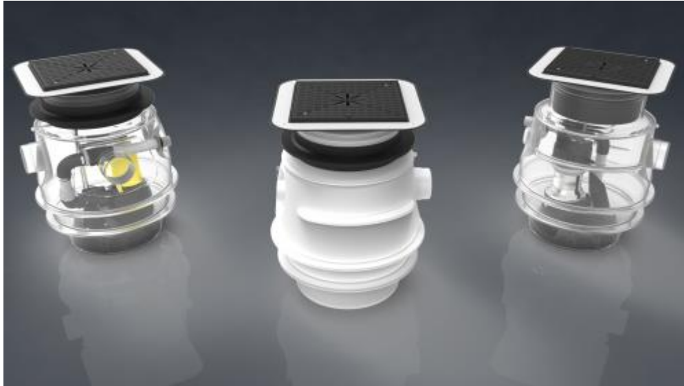
Bild 1: Ansichten des neuen BAUFIX 100 – links mit einer U3KS, rechts mit einer US103 Schmutzwasserpumpe