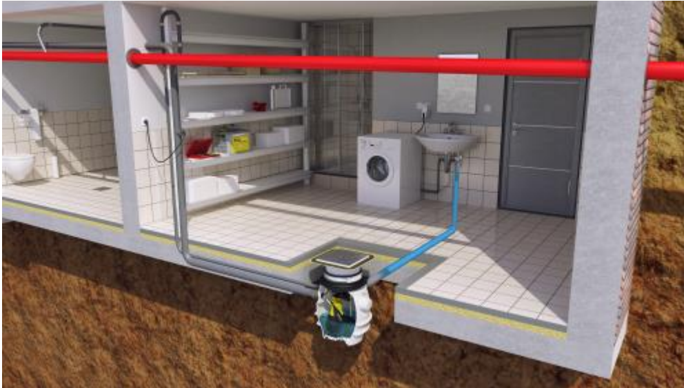
Bild 3: Kellerraum mit BAUFIX 100. Anschluss einer Waschmaschine und eines Waschbeckens. Ansicht der Baufix- Druckleitung und der abgehängten Abwassersammelleitung