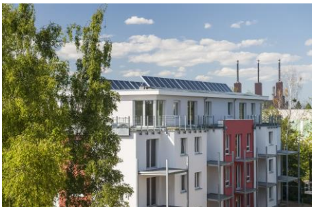
Foto 11: (Staffelgeschoss)

Unterm Himmel ist noch Platz: Um neuen Wohnraum zu schaffen, wurde in Lichterfelde auch aufgestockt und das zusätzliche Geschoss mit dem Inthermo Holzfaser-WDVS gedämmt. Dabei kamen 18 cm dicke Holzfaserdämmplatten des Typs Inthermo HFD-Exterior Compact zum Einsatz.