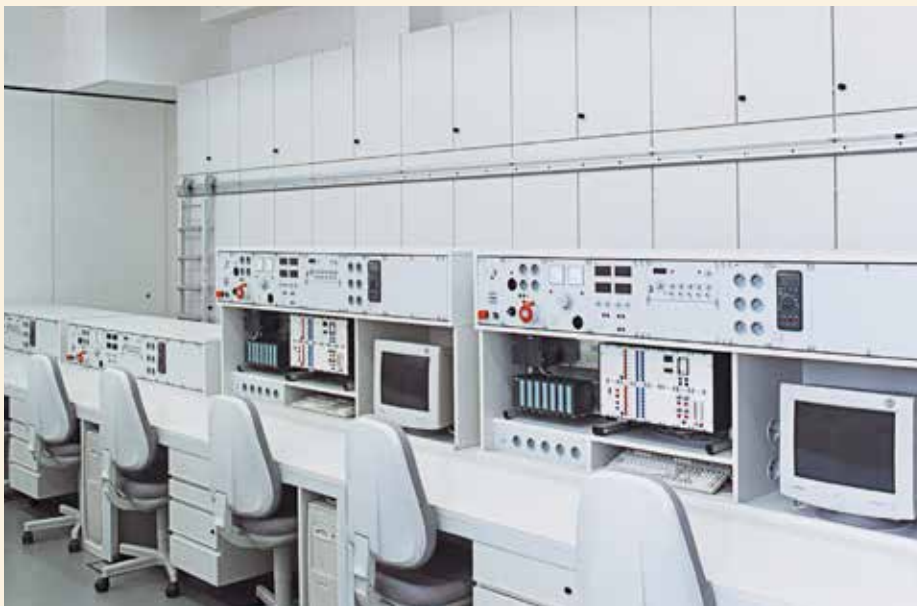
Komplette Büroeinrichtung: Neben Laborarbeits-tischen entwirft und fertigt erfi auch Büroeinrichtungen. Damit wurden Unternehmen wie Heidelberg Druck oder Mercedes Benz ausgestattet.