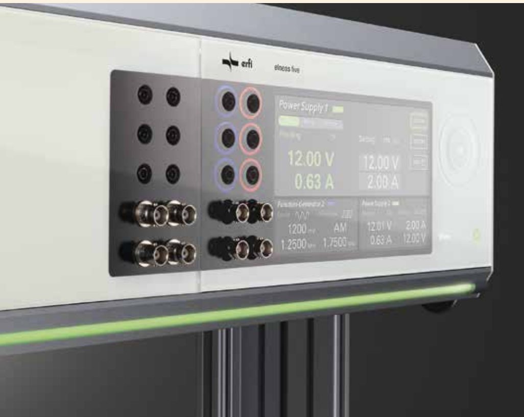
Arbeitsplatz mit Touch: elneos five verfügt über eine kapazitive Touchoberfläche, der sich über ein-, zwei-, drei- und fünf-Finger-Gesten bedienen lässt.

die Entwicklung unter LabVIEW von National Instruments und den konsequenten Einsatz von Grund- und Ausbaumodulen konnten selbst komplexe Prüfanlagen schnell gefertigt werden.