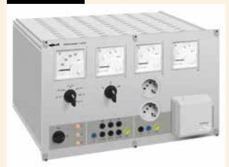
Netzgerätegeneration: Die erste fernsteuerbare Regelnetzgeneration für das Elektroniklabor.