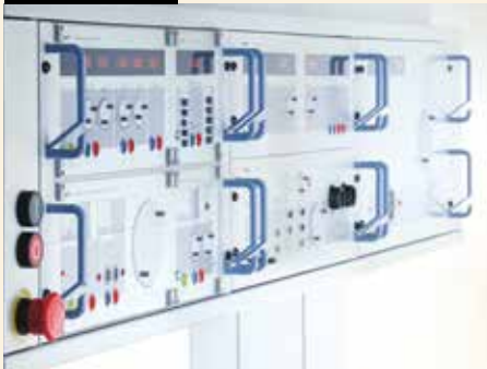
Aluminiumsystem: Auf der Productronica in München wurde das System „highlab“ vorgestellt.