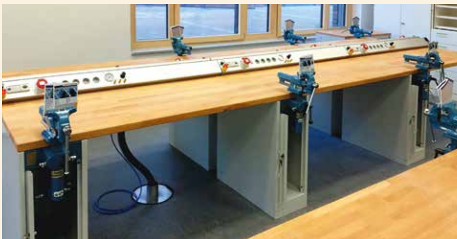
Labortisch: Ein klassischer und funktionaler Arbeitsplatz, wie ihn erfi für ganz unterschiedliche Anwendungen gebaut hat.

wickler bei erfi und sie weiteten das Angebot von highlab aus: Die Labormöbel aus Aluminium waren jetzt auch als Gerätesystem verfügbar. Gleichzeitig legte man bei erfi Wert auf Ergonomie und Gestaltung. Ein gutes Design zeichnet sich durch Integration der Form zusammen mit Handhabung, Funktion und Usability aus.