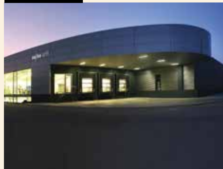
Neubau: 3,5 Mio. Euro flossen in eine neue Produktionshalle mit integriertem Kundencenter.