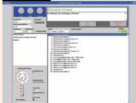
Betriebssystem: Automatisierte Prüfabläufe für Testsysteme wurden mit Windows gesteuert.