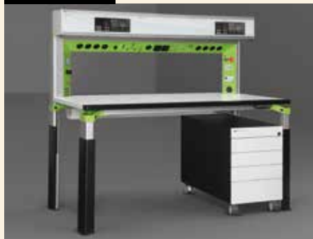
Vernetzt: „elneos five“ und „elneos connect“ sind ein System aus Geräte- und Laborarbeitsplatz.