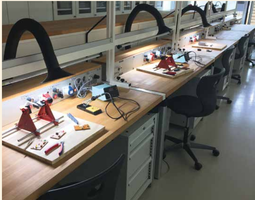
Einsatz Werkbank: Gerade für die Entwickler bieten sich die funktionalen Werkbänke von erfi an. Alle wichtigen Anschlüsse sind griffbereit.