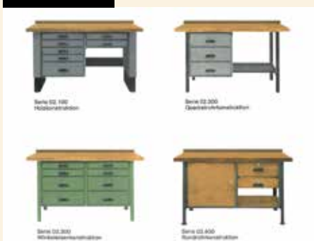
Industriewerkbank: Sie wurde aufgrund des Erfolgs rasch zu einem Werkbanksystem ausgebaut.