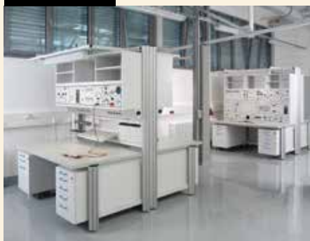
Möbelsystem: Das Modell „ varantec “ ist Benchmark der modularen technischen Arbeitsplatzsysteme.