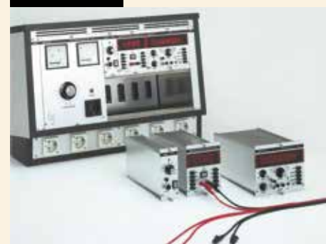
System MPL: Grundlage ist die Idee, alle Gerätekomponenten mit einem 19"-Einschub zu bauen.