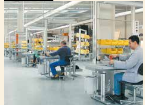
Heidelberger Druck: Der bis dahin größte Auftrag hatte einen Wert von 3,5 Mio. DM mit „highlab“.