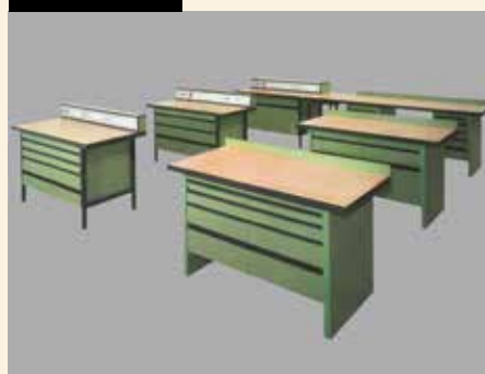
Labormöbelsystem: Mit dem aufblühen der Elektronikproduktion stieg der Bedarf an Laborsystemen.