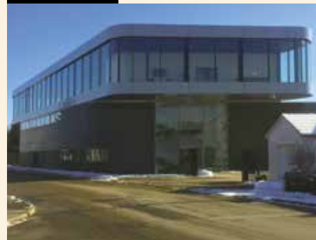
Moderne Produktion: Ein neues Kundencenter und eine Möbelproduktion mit vernetzter Anlage.