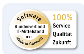
BITMi-Gütesiegel "Software Made in Germany"