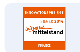
Innovationspreis-IT 2014 der "Initiative Mittelstand"