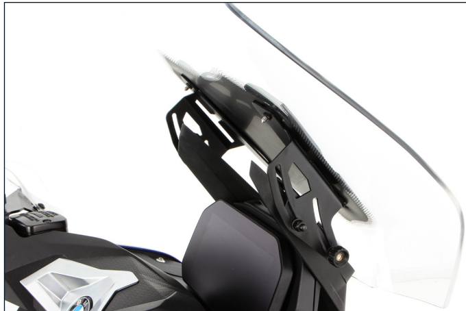
Durchdachter Mechanismus ist präzise aus Edelstahl gefertigt und schwarz pulverbeschichtet (Art.-Nr.: 25371-000)