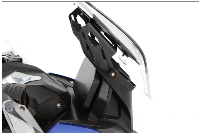
Aus der serienmäßigen Grundeinstellung um 60 mm stufenlos nach oben verschiebbar...