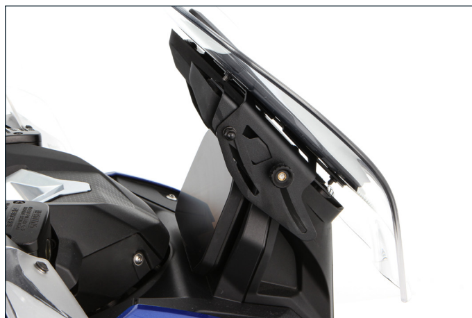
Ergonomisch griffgünstig angeordnetes Rändelrad zum einfachen Einstellen, auch unterwegs