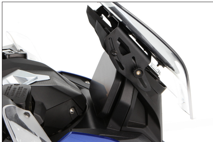
... und in jeder gewünschten Position arretierbar