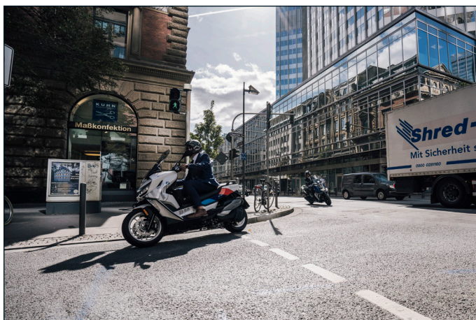
Wunderlich BMW C 400 GT