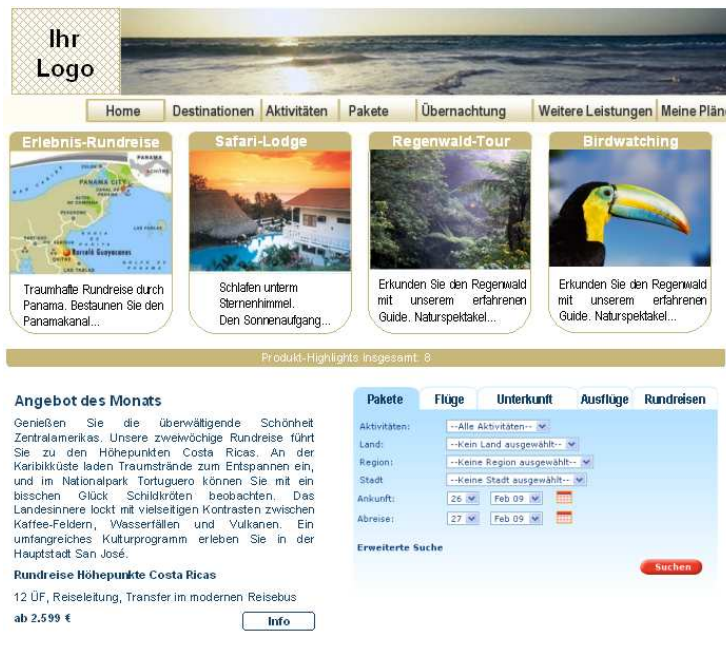
Erstes Scribble der smart4u Website-Lösung

Für individuelle Anforderungen von Reiseveranstaltern bietet zts weiterhin die umfassende Veranstalter-Software zts.42, die mit spezifischen Entwicklungen flexibel an Bedürfnisse angepasst werden kann.