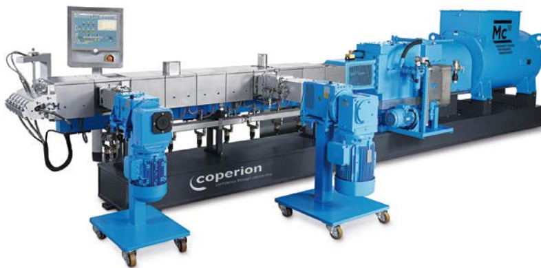
Das auf intelligenten Sensorknoten basierende Überwachungs- und Optimierungssystem verbessert beispielsweise Mischverfahren auf Doppelschneckenextrudern.

Das Fraunhofer LBF in Darmstadt steht seit 80 Jahren für Sicherheit und Zuverlässigkeit von Leichtbaustrukturen . Mit seinen Kompetenzen auf den Gebieten Betriebsfestigkeit, Systemzuverlässigkeit, Schwingungstechnik und Polymertechnik bietet das Institut heute Lösungen für wichtige Querschnittsthemen der Zukunft: Systemleichtbau, Funktionsintegration und cyberphysische maschinenbauliche Systeme. Im Fokus stehen dabei Lösungen für gesellschaftliche Herausforderungen wie Ressourceneffizienz und Emissionsreduktion sowie Future Mobility. Umfassende Kompetenzen von der Datenerfassung im realen betrieblichen Feldeinsatz über die Datenanalyse und die Dateninterpretation bis hin zur Ableitung von konkreten Maßnahmen zur Auslegung und Verbesserung von Material-, Bauteil- und Systemeigenschaften bilden dafür die Grundlage. Die Auftraggeber kommen u.a. aus dem Automobil- und Nutzfahrzeugbau, der Schienenverkehrstechnik, dem Schiffbau, der Luftfahrt, dem Maschinen- und Anlagenbau, der Energietechnik, der Elektrotechnik, der Medizintechnik sowie der chemischen Industrie. Sie profitieren von ausgewiesener Expertise der über 400 Mitarbeiter und modernster Technologie auf mehr als 11 560 Quadratmetern Labor- und Versuchsfläche.