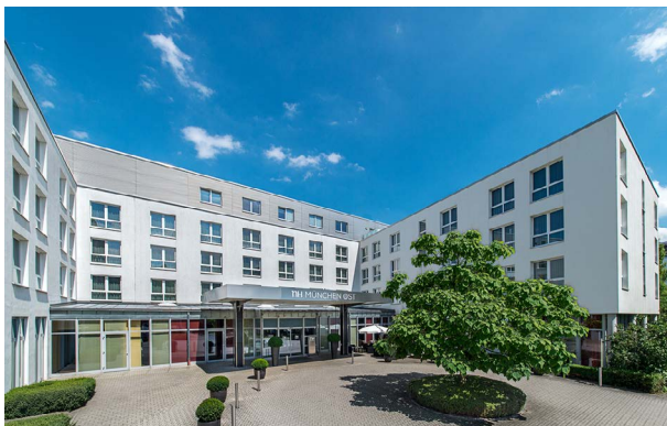
NH München Ost Conference Center