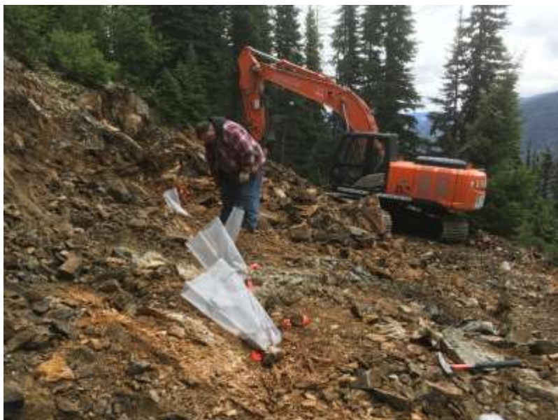
Foto der Gesteinssplitterprobenahmen und Grabungen im Zielgebiet Railroad für New Destiny.

New Destiny Mining Corp. hat vor Kurzem ein erstes Programm mit Gesteinssplitterprobenahmen, Grabungen und Bohrstandortvorbereitungen abgeschlossen und die wichtigsten Analyseergebnisse der Proben bekannt gegeben. Im Zielgebiet Superior (Lucky Todd) lieferte eine Probe Werte von bis zu 1,6 % Kupfer, 0,87 Gramm Gold pro Tonne und 109 Gramm Silber pro Tonne, eine weitere von 0,36 % Kupfer und 3,99 Gramm Gold pro Tonne. Proben aus dem Zielgebiet Railroad ergaben 1,06 % Kupfer und 264 Gramm Silber pro Tonne bzw. 0,95 Gramm Gold pro Tonne, 0,9 % Zink und 0,4 % Blei. Bei allen Proben handelte es sich um Splitterproben mit unterschiedlichen Breiten zwischen 0,3 und 1,5 Metern. Die wahren Mächtigkeiten der Zonen sind zu diesem Zeitpunkt unbekannt.