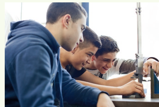
METALLBAU UND FEINWERKTECHNIK