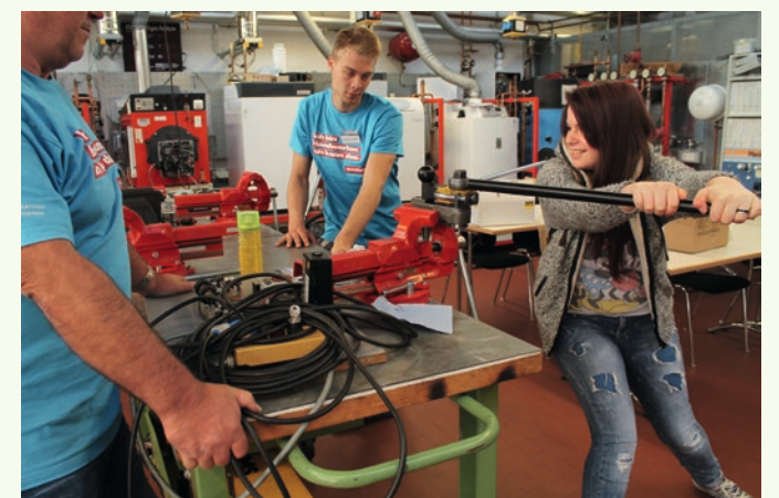
SANITÄR-, HEIZUNGS- UND KLIMATECHNIK