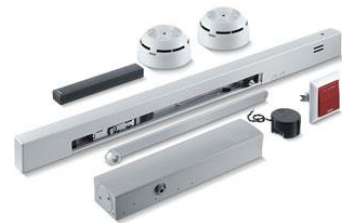
Die neue GEZE Funkerweiterung FA GC 170

Gebäude sicherer, komfortabler, effizienter und damit wirtschaftlicher betreiben: GEZE stellt neue innovative Systemkomponenten für Brandschutztüren vor. Ein weiteres Highlight ist das neue Gebäudeautomationssystem GEZE Cockpit als erstes smartes Tür-, Fenster- und Sicherheitssystem.