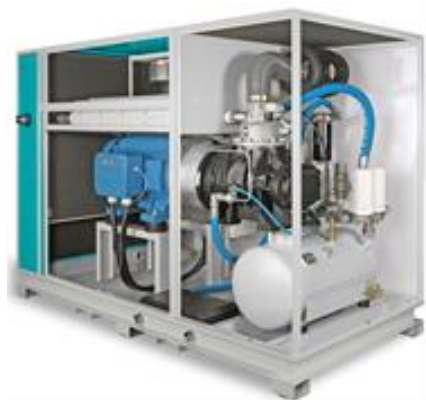
Renner Schraubenkompressoren (Foto: Renner).

Die Hannover Messe ist für Renner eine gute Plattform, um seine Produkte potenziellen Kunden zu präsentieren und seit Jahren nicht mehr aus dem Kalender wegzudenken.