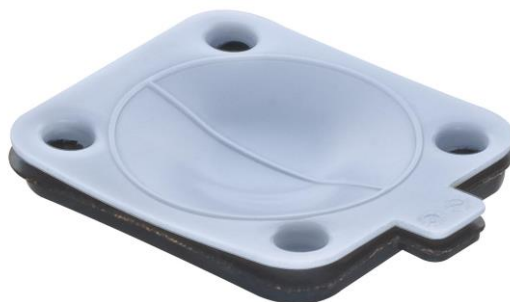
Absperrmembran der Gottlob Dietz GmbH (Foto: Dietz).

Das Unternehmen möchte die Hannover Messe vor allem nutzen um Neukunden zu gewinnen. Zudem sieht das Unternehmen die Industriemesse als gute Möglichkeit, bestehende Geschäftsbeziehungen zu pflegen.