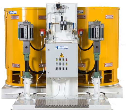
Blech- und Metallverarbeitung aus einer Hand bei Schaller.

Das Wertheimer Unternehmen möchte die Hannover Messe nutzen um Neukunden zu gewinnen.