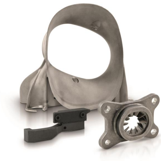
Produkt der SBV Stahltechnik GmbH.

Das Unternehmen aus Oedheim möchte mit seiner Teilnahme an der Hannover Messe zeigen, dass auch in wirtschaftlich guten Zeiten Kontinuität in der Beziehung zu Kunden wichtig ist.