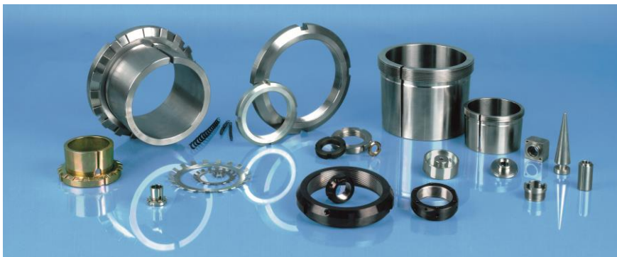
Produkte von Armbruster.

„Wir haben in Hannover nicht nur eine besonders gute Möglichkeit, die Trends und Entwicklungen der Branche zu erkennen, sondern diese durch die Präsentation innovativer und einzigartiger Produkte auch aktiv mitzugestalten. Mit der IHK vertrauen wir auf einen langjährigen Partner, mit dem wir schon viele Messeauftritte professionell und im Umfeld starker Unternehmen unserer Region realisiert haben.“