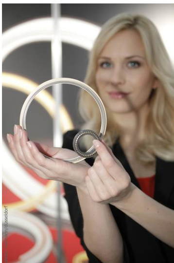
Produkte der Firma GDF (Foto: ctillmann/ Düsseldorf).

Auf der Hannover Messe werden Techniker und Ingenieure Fragen zu Einsatzmöglichkeiten, Anwendungen und Problemlösungen beantworten.