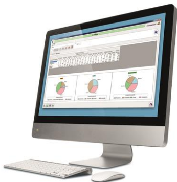
Energiemanagement-System von Provitec (Foto: Provitec).

„Das Potenzial von Proenergic® ist immens und so ist es kein Wunder, dass wir unter anderem eine renommierte Verbraucherkette aus Süddeutschland von unserem Konzept überzeugen konnten. Seit 2013 ist PROENERGIC® in den Märkten implementiert, und der Energieverbrauch wird seitdem transparent, lückenlos dokumentiert und effizient gesteuert. Denn in Zukunft entscheidet der optimale Umgang mit Ressourcen über die langfristige Wettbewerbsfähigkeit am Markt.“