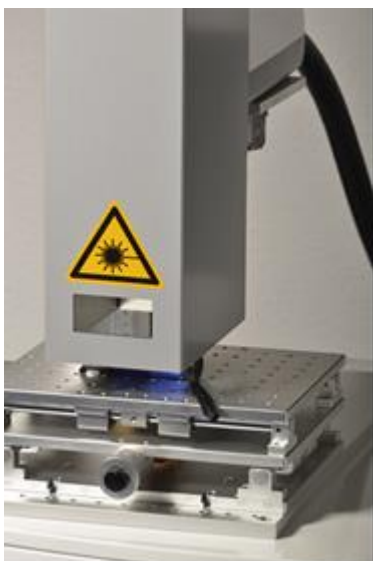
Lasertechnik zur Beschriftung von Werbeartikeln (Foto: MSW).

Das Unternehmen sieht die Hannover Messe als gute Möglichkeit, neue Geschäftskontakte zu knüpfen.