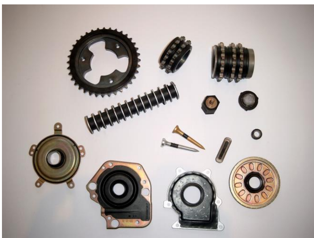
Produkte der Schwarz GmbH & Co. Kg für hohe technische Anforderungen.

Die Industriemesse ist für die Siegelsbacher eine gute Plattform, um ihre Produkte internationalen Fachbesuchern zu präsentieren und neue Geschäftskontakte zu knüpfen.