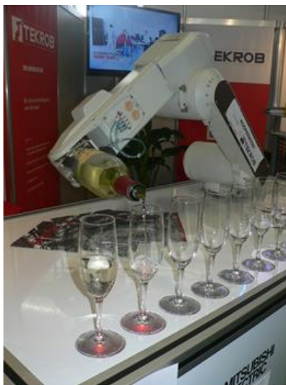
Eine Lösung von Tekrob im Bereich Automatisierung.

"Als zuverlässiger Partner renommierter Hersteller der Automobilindustrie und durch den Einsatz der Industrieroboter in verschiedenen Wirtschaftszweigen der Industrie, möchten wir weitere Kontakte knüpfen und eine Vertrauensbasis für die Zusammenarbeit mit potentiellen Kunden weltweit bilden. Die ersten Meilensteine wurden bereits mit den Tochterwerken in der Türkei und in Mexiko im Jahre 2012 gelegt".