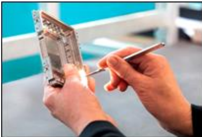
Produkt der Matthias Meidlinger GmbH.

„Als international tätiges Unternehmen ist es uns natürlich wichtig, dass wir uns auf einer solch renommierten Messe einem internationalen Publikum entsprechend präsentieren.“