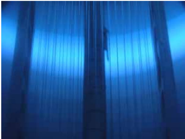
Textilfasern in der Plasmabeschichtungsanlage.