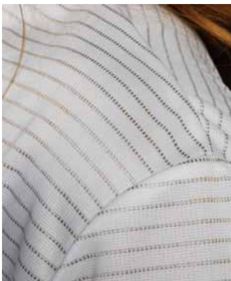
Ein antistatisches und antibakterielles T-Shirt, das mit Silber beschichtete Fasern enthält.