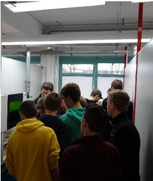
Abbildung 4: Laserbeschriften von Kugelschreibern am EasyMark