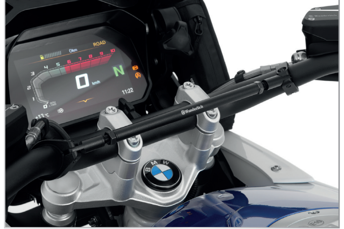
... oder wahlweise in schwarz