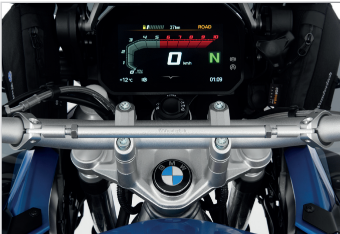
Optisch exakt auf den Lenker der GS abgestimmt