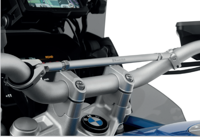
Wunderlich Lenkermittelstrebe an BMW R 1250 GS in Silber ...