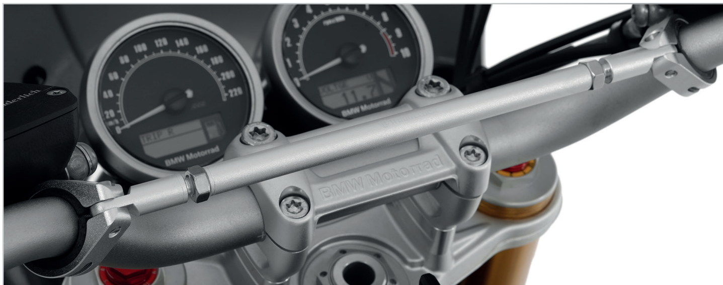
Für viele weitere BMW-Modelle - hier zu sehen an der BMW R nineT (Art.-Nr.: 25036-001)