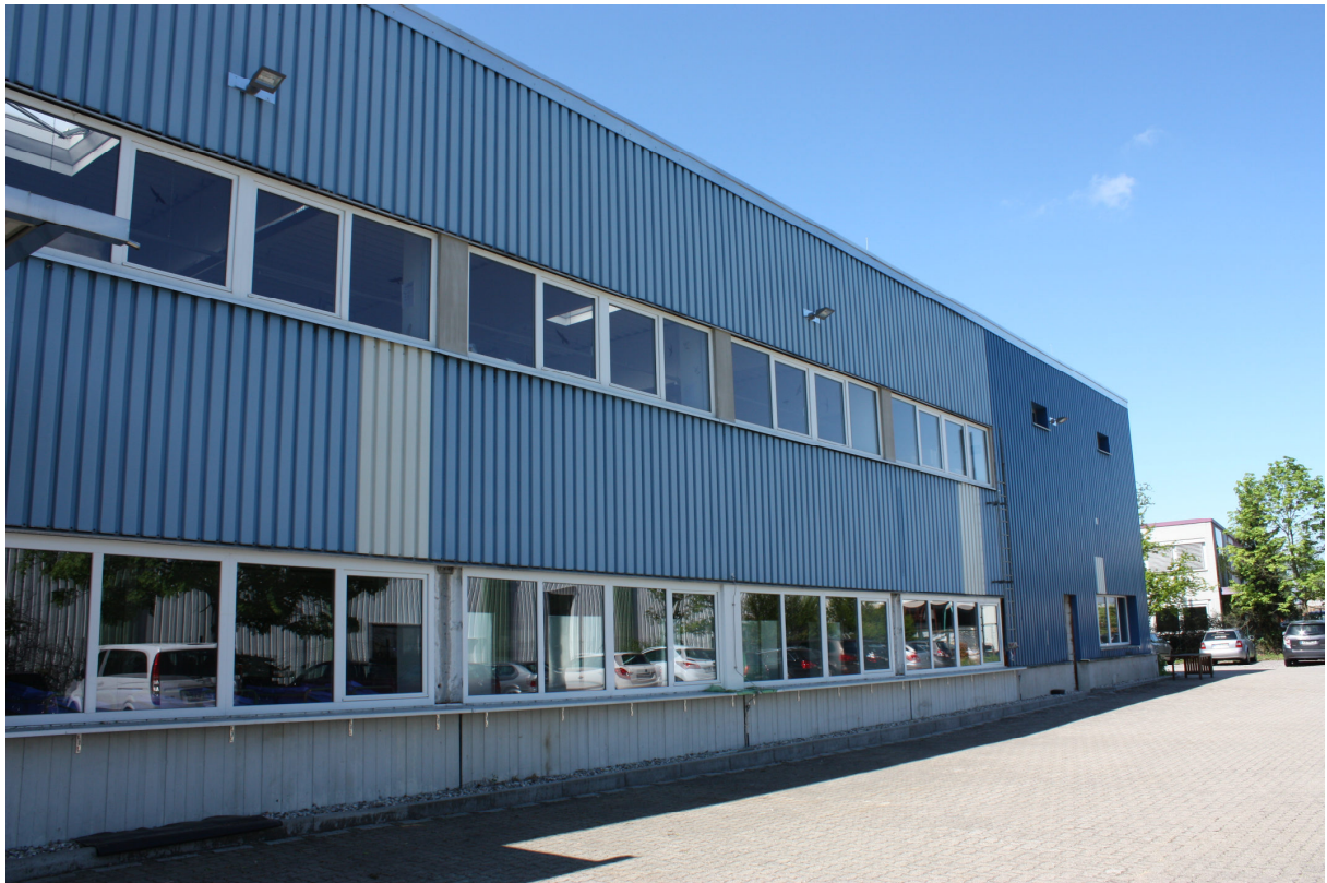
Bild 1: 20120503_8867.JPG

Die Gewerbehalle vor Ihrem „Lifting“ – ein schlichter blauer Kubus.