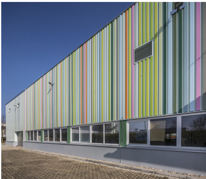
Bild 4: 20130322_018_CAPAROL Gewerbehalle Leverkus Karlsruhe__S2C418.JPG

Passen die Farbtöne wirklich zusammen? Die ungewöhnliche Farballianz überzeugt nicht nur Firmenchef Heiko Leverkus.