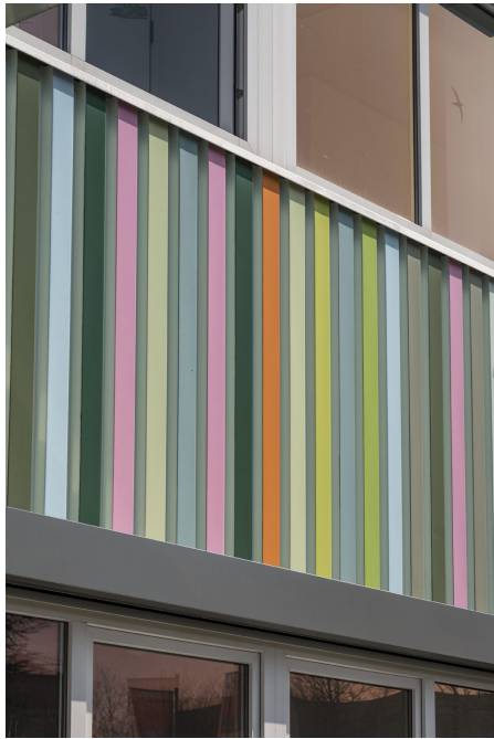
Bild 3: 20130322_024_CAPAROL Gewerbehalle Leverkus Karlsruhe__S2C419.JPG

Passen die Farbtöne wirklich zusammen? Die ungewöhnliche Farballianz überzeugt nicht nur Firmenchef Heiko Leverkus.