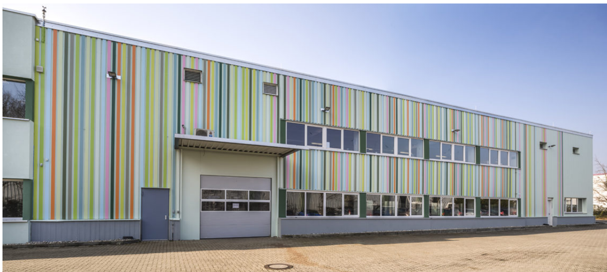
Bild 2: 20130322_004_CAPAROL Gewerbehalle Leverkus Karlsruhe__S2C415.JPG

Die Gewerbehalle vor Ihrem „Lifting“ – ein schlichter blauer Kubus.