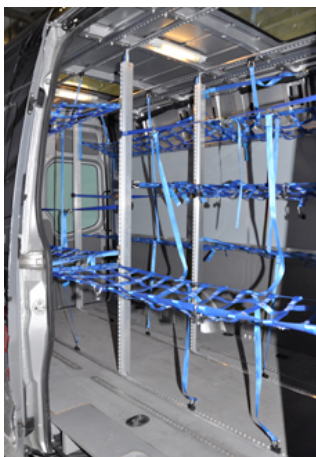
Bild: „TransSAFE Rack“ von allsafe JUNGFALK – das vorteilhafte Ladegutsicherungs-System mit dem geringen Gewicht