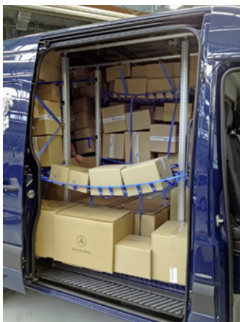
Bild: „TransSAFE Rack“ beladen mit Paketen von allsafe JUNGFALK – das vorteilhafte Ladegutsicherungs-System mit dem geringen Gewicht