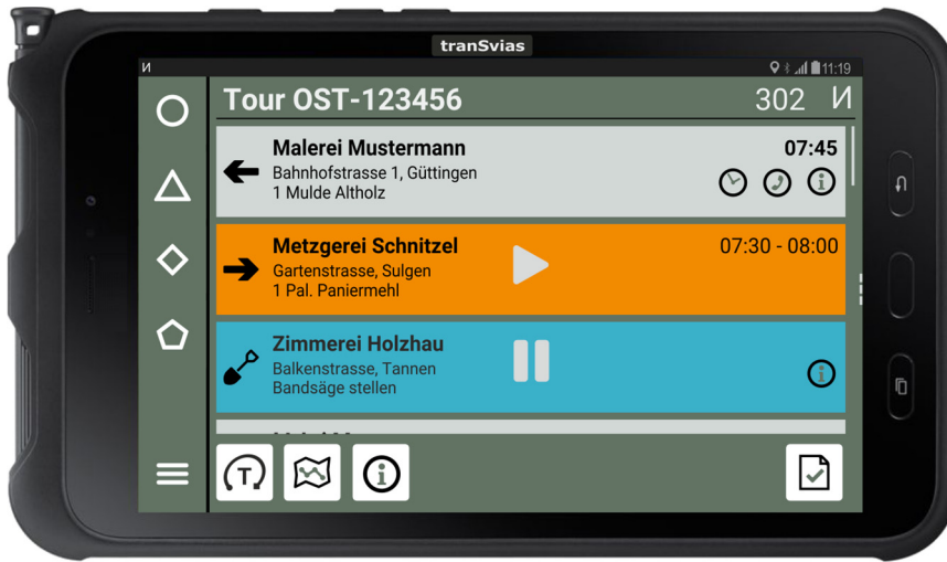
tranSvias drive Fahrer App (Auftragsliste) [200303-nufatron-tranSvias-drive-rgb.png]