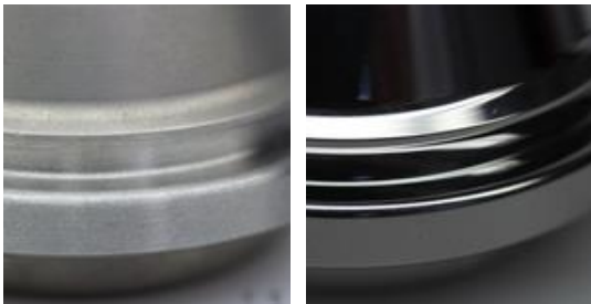
Formflächen der Dosenverschlusswerkzeuge vor und nach der OTEC-Bearbeitung

Das OTEC-Verfahren bietet erhebliche Kostenvorteile aufgrund der deutlich schnelleren Bearbeitungszeit im Vergleich zu den herkömmlichen Methoden. Durch die teilweise sehr großen Bearbeitungskräfte wird es möglich, selbst in kleinen Rillen oder Nuten hochfeine Oberflächen zu erreichen. Die Streamfinishanlagen können für große Unternehmen mit hohen Stückzahlen auch mit entsprechenden Automatisierungslösungen ausgestattet werden.