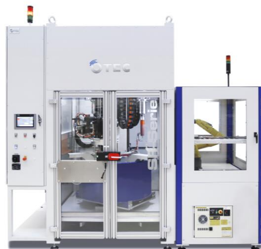
Streamfinishmaschine SF 3 Automation

Das OTEC-Verfahren bietet erhebliche Kostenvorteile aufgrund der deutlich schnelleren Bearbeitungszeit im Vergleich zu den herkömmlichen Methoden. Durch die teilweise sehr großen Bearbeitungskräfte wird es möglich, selbst in kleinen Rillen oder Nuten hochfeine Oberflächen zu erreichen. Die Streamfinishanlagen können für große Unternehmen mit hohen Stückzahlen auch mit entsprechenden Automatisierungslösungen ausgestattet werden.