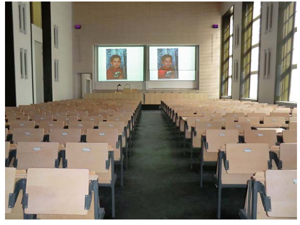
Projektion vom Visualizer (WolfVision). HS 201

Doppelprojektion für unterschiedliche Bild- oder Videoübertragungen, zusätzliche Monitore. Oberhalb die Schwerhörigen- und Dolmetscheranlage mit separaten Infrarot-Transmittern. HS 202