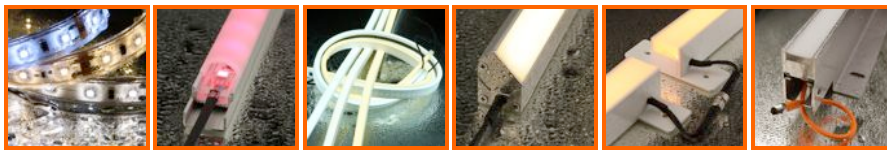
LED Linear Lampen und Leuchten in der Schutzart IP00 bis IP68