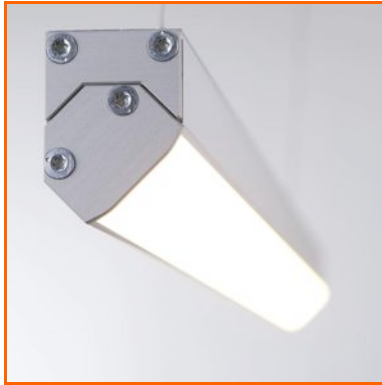
xoolum™ red dot: best of the best