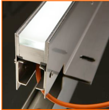
VarioLED™ OCEANOS red dot award: product design 2012

reddot design award best of the best 2012