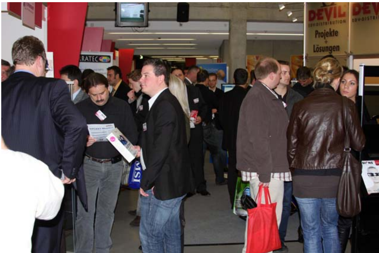
Von früh an war die Veranstaltung gut besucht