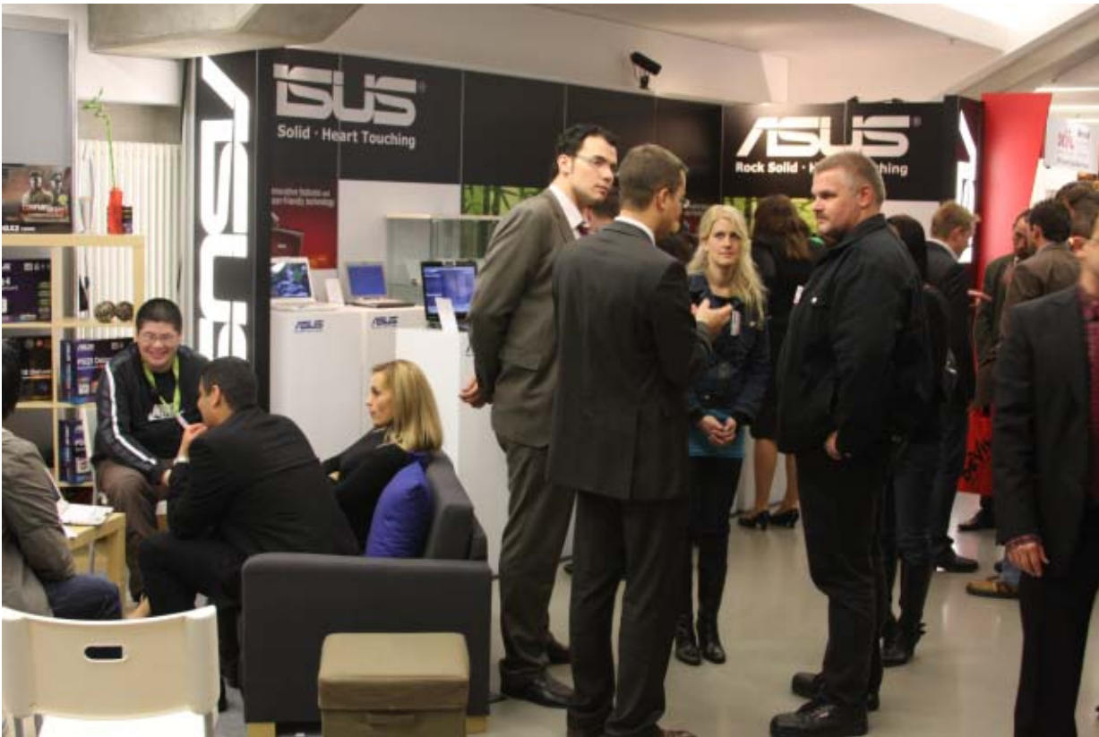
Die Messe bot gute Gelegenheit für intensive Gespräche zum Auftakt der Saison