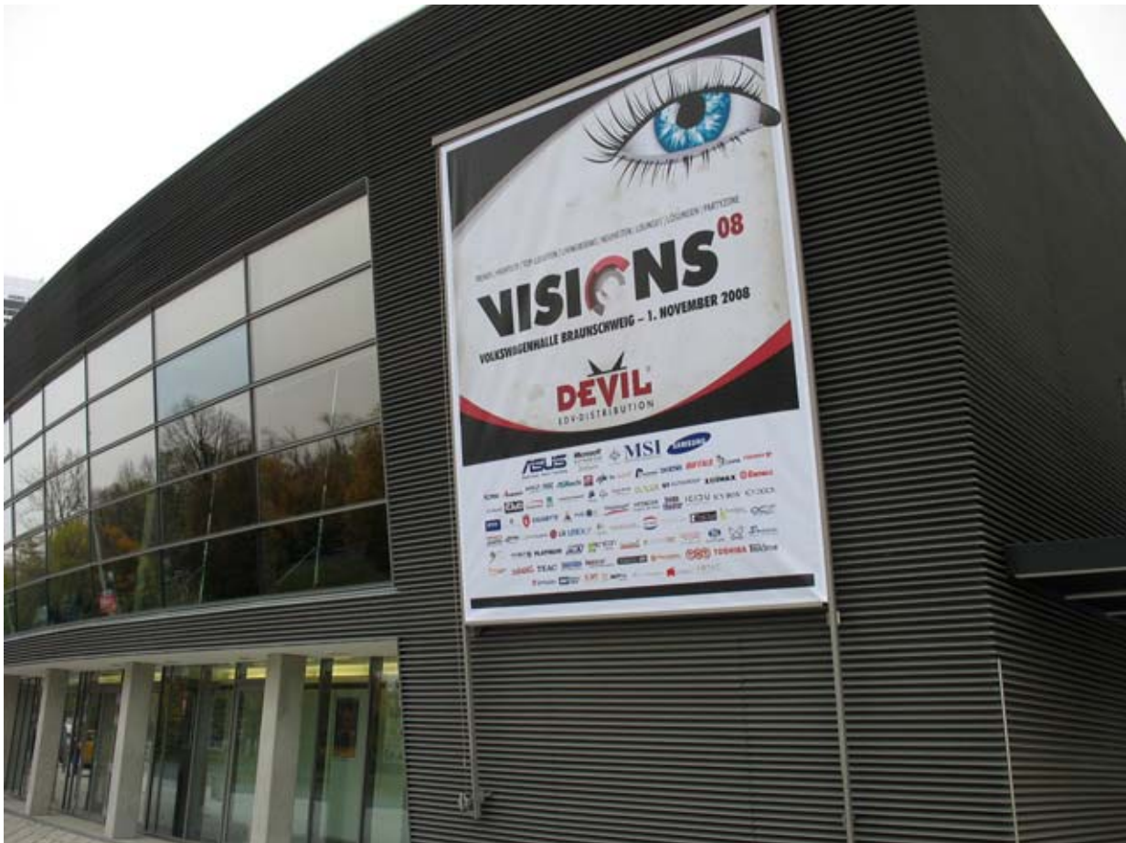
Devil Visions 08 in der VW-Halle Braunschweig am 1. November. Die Location bot den passenden Rahmen zur Veranstaltung

Mit der bundesweiten EDV-Distribution ist die Braunschweiger DEVIL AG etablierter Partner von rund 130 international renommierten IT-Herstellern und -Lieferanten. Zum Kundenstamm zählen über 7.000 Fach- und Systemhändler. Das Unternehmen erwirtschaftet mit etwa 200 Mitarbeitern einen Jahresumsatz von zuletzt 322 Millionen Euro und zählt zu den führenden Großhändlern am deutschen IT-Absatzmarkt. Das Portfolio umfasst stark nachgefragte Hardware- und Peripherieartikel rund um den PC in kontinuierlicher Verfügbarkeit zu stundenaktuellen, attraktiven Preisen. Rasche Kommunikation am Markt und zuverlässige, pünktliche Auslieferung verschaffen der DEVIL AG entscheidende Wettbewerbsvorteile. Kunden, die bis 18:30 Uhr Waren bestellen, erhalten diese am folgenden Tag. Seit Juli 2006 agiert DEVIL als selbstständiges Unternehmen unter dem Dach der niederländischen Nedfield NV (vorher Tulip Computers NV). Mehr Informationen unter www.devil.de