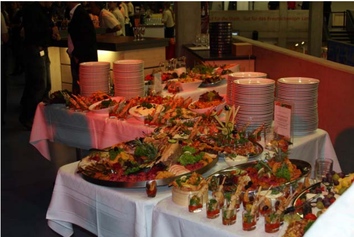
Opulentes Buffet zum Auftakt des Abendprogramms