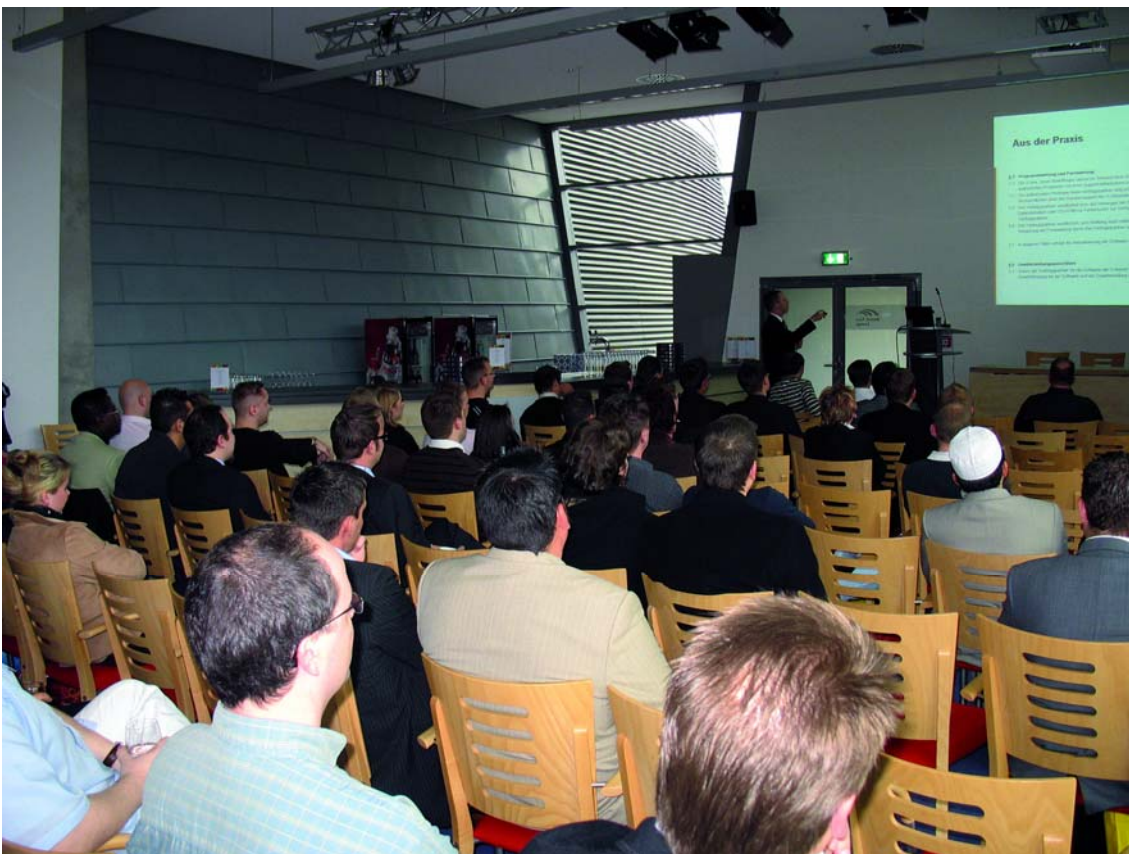
Die Vorträge und Workshops waren von Fachhändlern sehr gut besucht