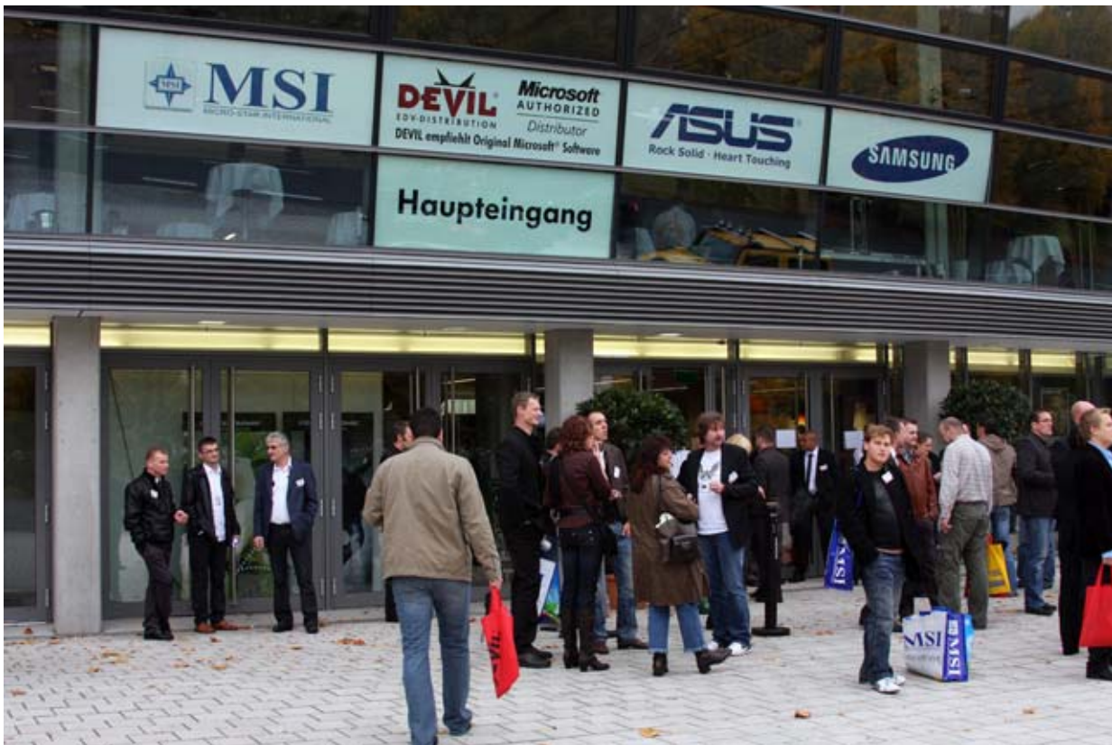
Haupteingang zur Visions 08