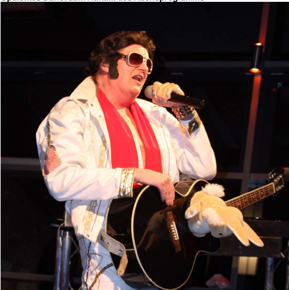
Die Live-Band Skydogs bot eine heiße Bühnenshow