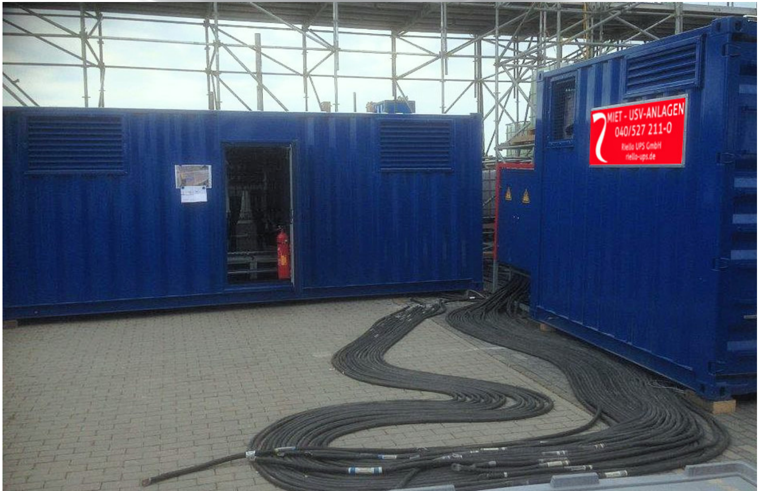
Einsatzbeispiel Fußballstadion 2 x 250 kVA