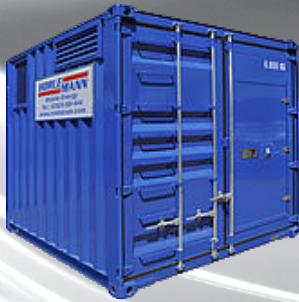
Container 250 kVA